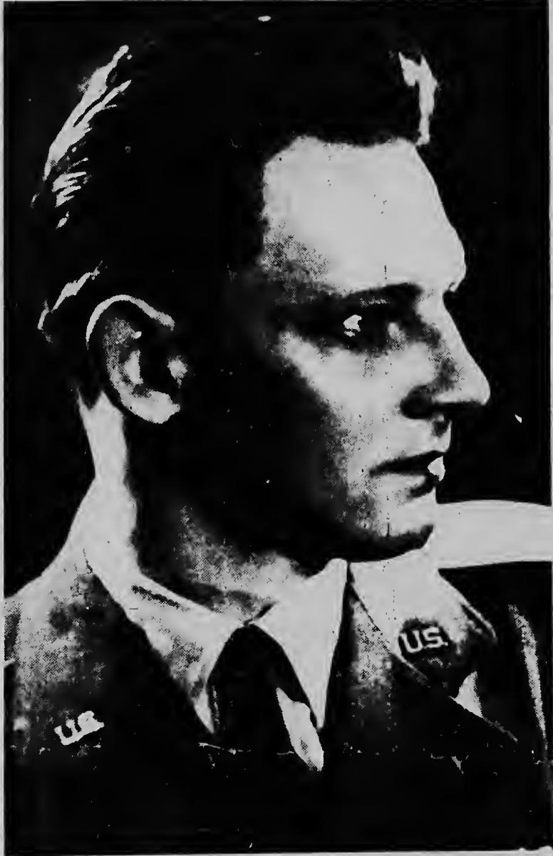
NORTH SALEM N, Y.--Esaki ta un foto di file di e piloto di e avion di Eastern Airline, piloto Charles White, kende mester a hasi un aterrizaje di emergencia cu su constelacion riba serru, despues cu su avion a dal contra un jet. White a hasi un milager pa e 49 sobrevivientenan di su avion, pero e mes a muri durante e aterrizaje di emergencia.